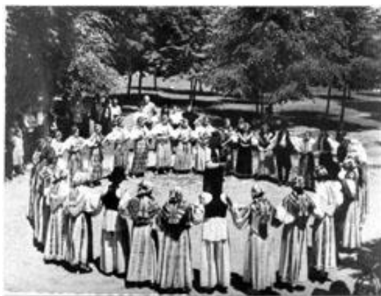
Slika 6. Slavonsko kolo u Gorjanima, Đakovština, 1957.