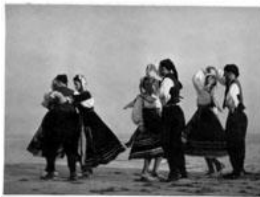
Slika 8. Dobrinjski tanac, 1951.