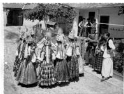
Slika 11. Mačevni ples slavonskih kraljica

Od mačevnih plesova treba spomenuti Slavonske kraljice, mačevni ples djevojaka karakterističan za sjeverni dio Hrvatske. Izvode se različite figure djevojačke igre zveckanjem i križanjem mačeva te provlačenjem ispod uzdignutih mačeva uz pratnju gajdaša ili tamburaša u novije vrijeme. Lančani plesovi s mačevima do danas su se održali još na Lastovu i Korčuli i poluotoku Pelješcu. Za Korčulu je karakteristična moreška – plesna bojna igra s mačevima. (culturenet.hr, 2018)