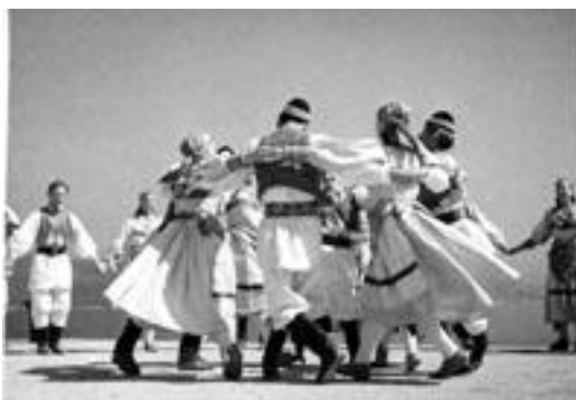
Slika 7. Drmeš iz Remeta, 1951.

Tanac je ples koji je najviše rasprostranjen duž cijele Jadranske obale, a javlja se i u Lici i gorskim krajevima. Za tanac je karakteristično izmjenjivanje plesa u kolu s plesanjem u dva nasuprotna reda ili s plesanjem u parovima. U parovima se često izvode figure u kojima se plesačice intenzivno okreću. (culturenet.hr, 2018)