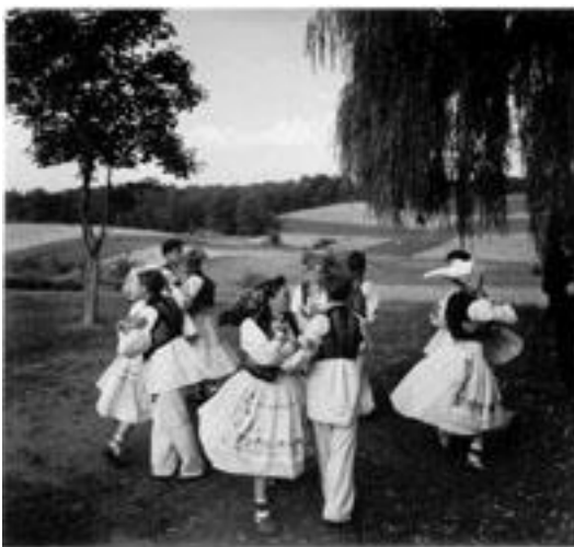
Slika 9. Drmeš u parovima, Pokuplje

Parovne plesove karakterizira sklonost plesača da se brzo okreću. Ponekad ih se može vidjeti i u kombinaciji s kolom. Ponekad se u parovnom plesu pojavljuje i zapovjednik plesa – kolovođa. On može predvoditi ples kao prvi plesač ili stajati u sredini plesnoga prostora i uzvikivati komande. Parovni plesovi su rasprostranjeni u cijeloj Hrvatskoj, od sjeverne Hrvatske, preko središnje, gorske do istočne i južne. (culturenet.hr, 2018)