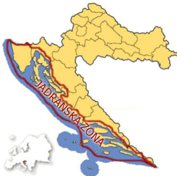
Slika 2. Jadranska zona

Jadranska plesna zona obuhvaća sve otoke i uski obalni pojas osim okolice Zadra i zadarskih otoka. Pretežno su parovni plesovi, ali parovi nisu jednolično raspoređeni po krugu. Često se pleše i u dvije nasuprotne linije ali tada žene čine jednu, a muškarci drugu liniju. U plesovima jadranske plesne zone često se susrećemo s istaknutom ulogom jednog plesača u sjevernim dijelovima kolovođa vodi kolo, a na jugu „izvodi bal“. (Srhoj, 2000)