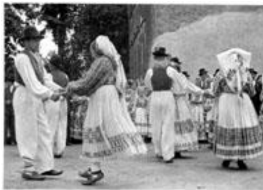
Slika 10. Ples staro sito iz posavskih brega

su postali simbolom kulturnog identiteta kao i ostali narodni plesovi. (culturenet.hr, 2018)