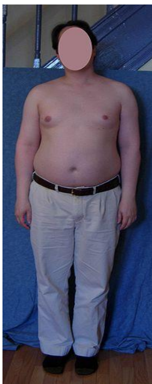
3. slika Muškarac s Klinefelterovim sindromom

Terapija osoba s Klinefelterovim sindromom sastoji se od primanja testosterona te im je potreban psihoterapijski pristup koji osigurava podršku oboljelima i njihovim obiteljima (MSD, 2004.).