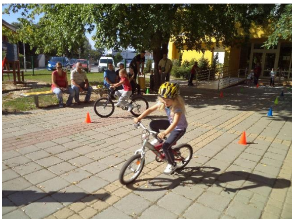
Slika 2. Vožnja biciklom

do trideset minuta (Neljak, 2010). Primjer za tematsko vježbanje je trčanje za balonima, vožnja biciklom itd.