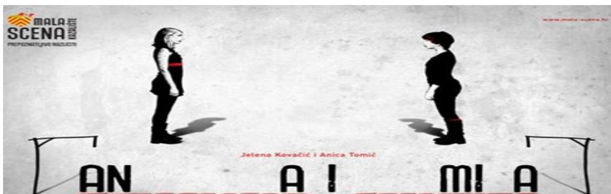
Slika 2. Plakat za predstavu „Ana i Mia“ kazališta Mala scena

http://www.mala-scena.hr/home/arhiva-predstava/ana-i-mia.aspx